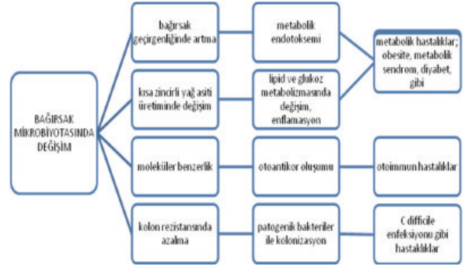
Şekil.1 İntestinal mikrobiyota değişiminin lokal ve sistemik etkileri.

Mikrobiyota dengesinde bozulma olduğunda bağırsak geçirgenliğinde artma, kısa zincirli yağ asiti üretiminde değişme, kolon rezistansında azalma gibi değişiklikler olduğu gösterilmiştir (Şekil.1). Enflamatuar bağırsak hastalığı, ateroskleroz, diyabetes mellitus, alkolik olmayan yağlı karaciğer hastalığı, metabolik sendrom, immün yetmezlik, otizm gibi birçok hastalıkta intestinal Mikrobiyota içeriğinde değişiklikler bildirilmiştir. Mikrobiyota değişikliğinin neden mi, sonuç mu olduğu konusunda da tartışmalar halen devam etmektedir 8,9 .